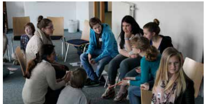
Angeregte Diskussionen in der Gruppe