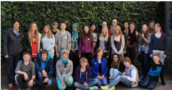
Die Teilnehmer des zweiten natec Camps 2014