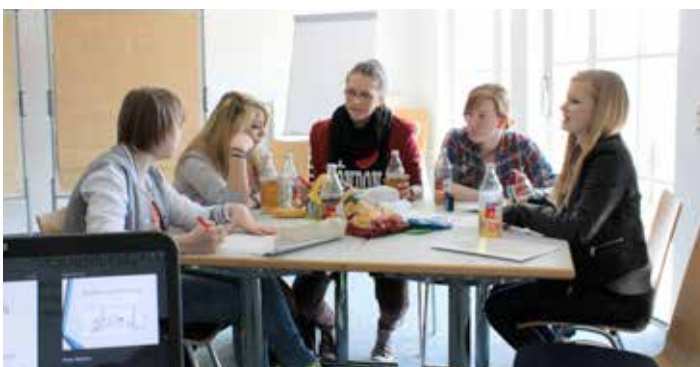
natec Mentorinnen konzentriert bei der Gruppenarbeit