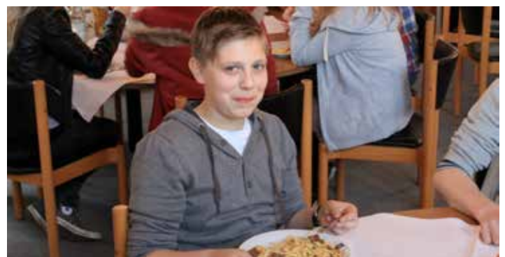
Auch die Verpflegung hat allen geschmeckt